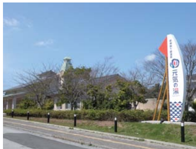
温泉施設「元気の湯」 (ホテルより200m)