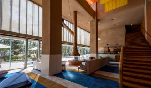
2018年レストラン、ロビーリニューアル