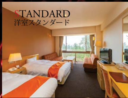
STANDARD 洋室スタンダード